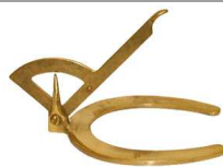
BRASS Hoof Gauge