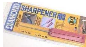
EZE Lap Tapered