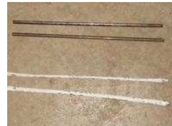
Borium & Hard Surface Rod